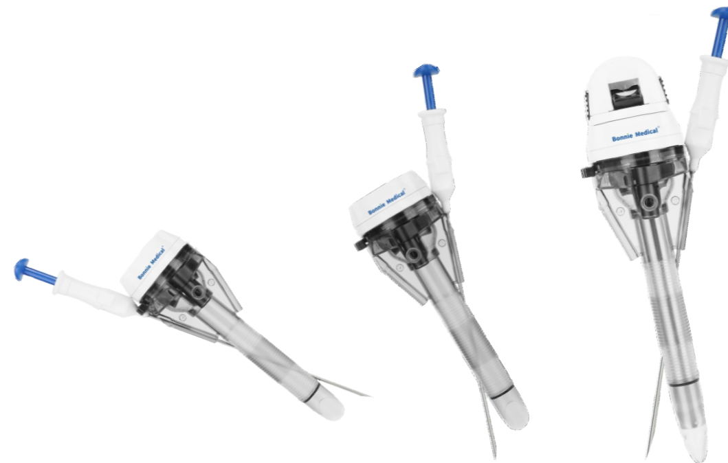
★ 标准款: 5mm | 10mm | 12mm | 15mm

用于腹腔镜检查和手术过程中,对人体腹壁组织穿刺,建立腹腔镜手术的工作通道以及在腹腔镜手术中缝线抓取,实现腹壁切口或戳卡口缝合。